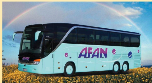
Moderne Reisebusse bei AFAN Reisen